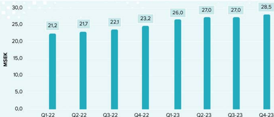
Kvartalsvis nettoomsättning och tillväxt

Vi såg en stark utveckling i vår brittiska verksamhet och även vår irländska verksamhet presterar enligt plan.